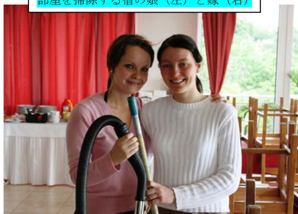
部屋を掃除する宿の娘（左）と嫁（右）

ブラチスラバ中央駅下車。徒歩 30 分。山に登るので少し疲れる。家族経営のホテルのようで、受付は温かい。シャワーのお湯量が弱い。ハウスキーピングが弱く、タオル交換を依頼するとしてくれるが、石鹸は補給したりしなかったりだ。室内からブラチスラバ市内を一望でき、その眺めは素晴らしい。室内は快適。おすすめ度◎。値段で割ると◎◎。